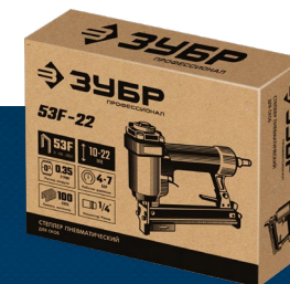
Упаковка: коробка картонная