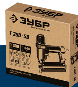
Упаковка: коробка картонная

Обрезиненная рукоятка для удобства хвата