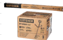
Упаковка: картонная коробка