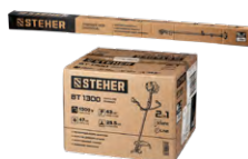
Упаковка: картонная коробка