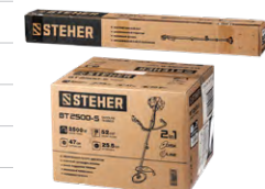
Упаковка: картонная коробка